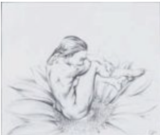
22 Oliver König Selbstportrait Bunt- und Bleistift auf Papier 40 x 27 cm

Konzepte oder Pläne habe ich beiseite gelegt. Sie schaffen kein Bild, sie lassen nichts in mir entstehen.