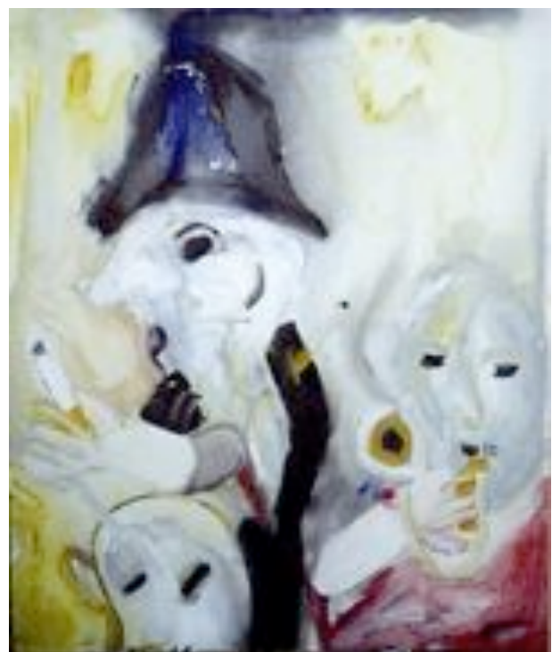
20 Stefan Janowski Raucherecke , 2005 Acryl auf Leinwand 60 x 50 cm