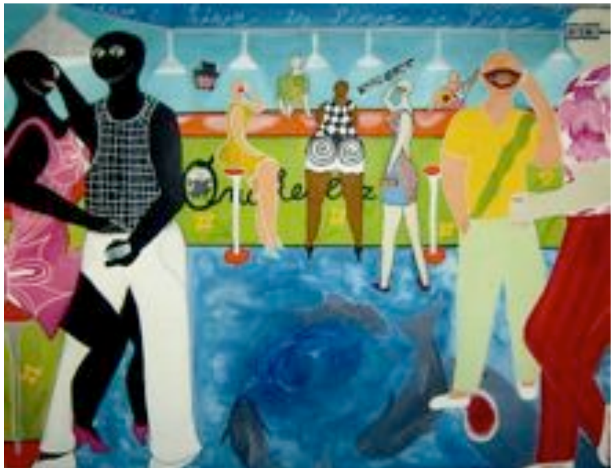
14 Heidi Förster live is live Acryl auf Leinwand 140 x 160 cm

In dem Bild „live is live“ habe ich Erfahrungen und Wahrnehmung meiner Umwelt zum Ausdruck gebracht. Der Humor, mit dem ich junge Leute beobachte, die eigene Jugendzeit und die Veränderung unserer Kommunikation.