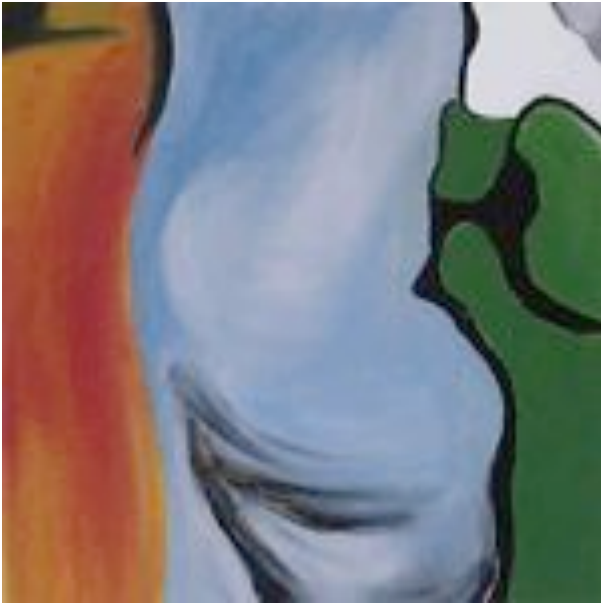
7-9 Ursula Büch Micro I-III, 2006 Öl auf Leinwand je 40 x 40 cm