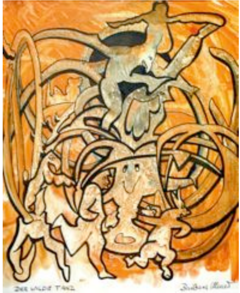
42 Barbara Ulmer Der wilde Tanz , 1996 Gouache, Tinte auf Papier 40,5 x 40 cm