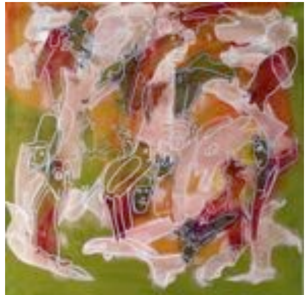
6 Ursula Büch Vogelfrei , 2006 Acryl, Copystift auf Leinwand 60 x 60 cm