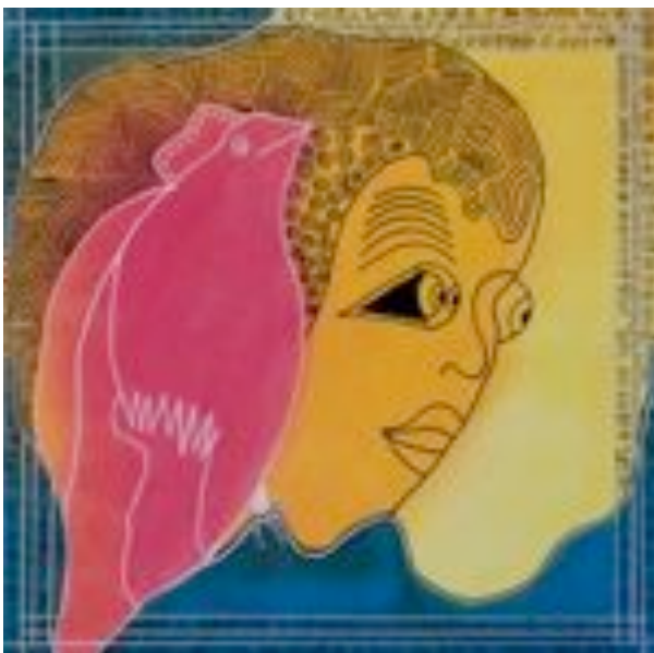
5 Ursula Büch Matirofi , 2006 Acryl auf Leinwand 60 x 60 cm

Ich kann mir nicht vorstellen, Malkurse zu besuchen. Ich hätte Angst meinen persönlichen Ausdruck zu verlieren. Meine Phantasie gleicht einem Vulkan, aus dem bisher nur kleine Wölkchen puffen. Deshalb bin ich auch sehr neugierig, wenn meine Phantasie mit dem Pinsel Feuer speit.