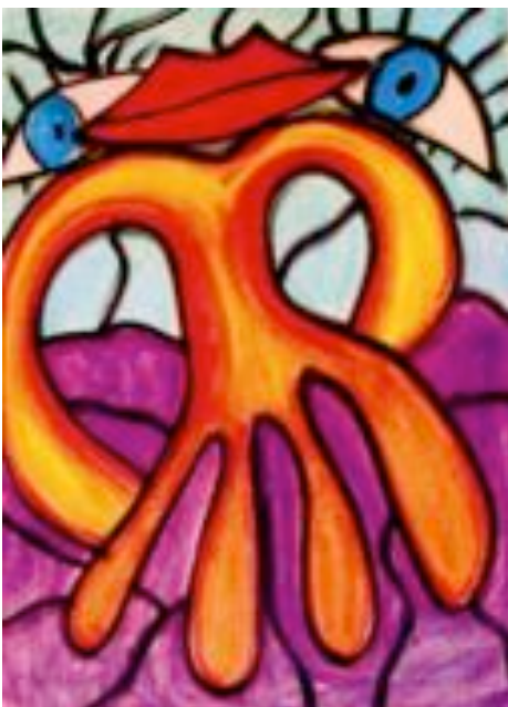
43 Gabriele Wiel Katzenmenschen, 2004 Pastellkreide auf Papier 40 x 60 cm

Heute lebe ich mit meiner Partnerin und meinen Tieren auf dem Land bei Düsseldorf und arbeite im Gartenbau einer Behindertenwerkstatt.